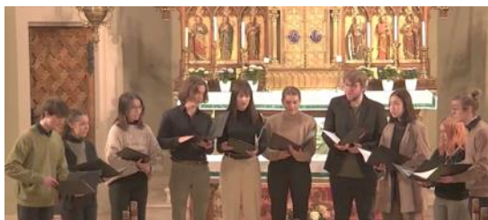
Vokalensemble Fynf und Vocalodie