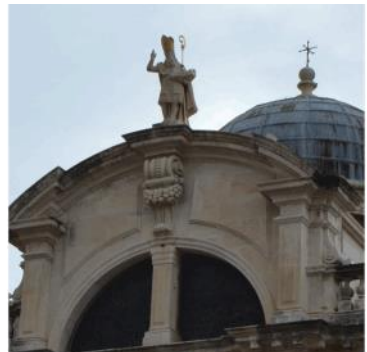
Bild: Statue des Hl. Blasius auf dem Dom von Dubrovnik –Schutzpatron der Stadt

Blasius war Bischof von Sebaste in Armenien. Nach der Legende erlitt er unter Kaiser Licinius um 316 einen grausamen Märtyrertod. Im Gefängnis soll er einem Knaben, der eine Fischgräte verschluckt hatte, das Leben gerettet haben; deshalb wird er im Osten und Westen gegen Halsleiden angerufen (Blasius-Segen seit dem 16. Jahrhundert). Seit dem späten Mittelalter gilt er als einer der Vierzehn Nothelfer.