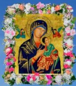
Mutter von der Immerwährenden Hilfe