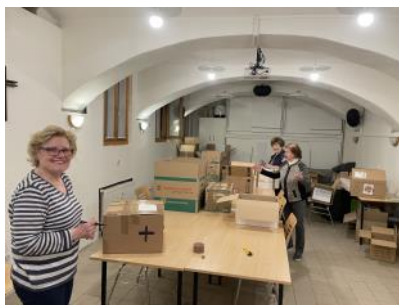
Einige Spenden sind schon eingepackt.

Die Aktion „Hilfe für Ukraine“ haben wir zusammen mit dem Pfarrverband, der Wichtelschule, dem Kindergarten der Marienpfarre und anderen Gruppen gestartet und wollen bis 31. 3. 2022 Sachspenden sammeln und am 2. April nach Polen-Tuchow zu den Redemptoristen bringen, die sie in die Ukraine weiter transportieren werden.