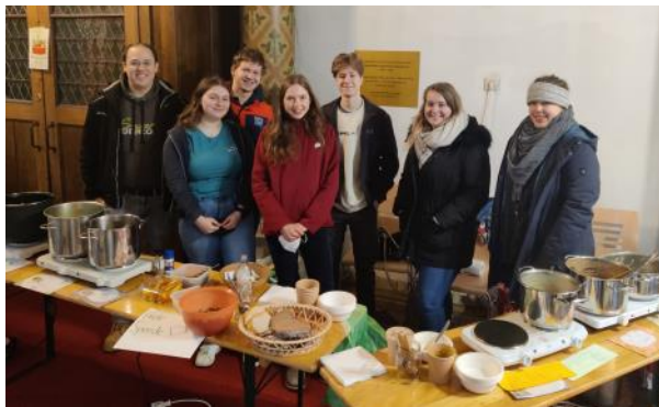
Die Gruppe der Verantwortlichen

Die seit zwei Jahren neu bestehende Jugendgruppe der Marienpfarre organisierte die „Fastensuppenaktion“ in der Marienpfarre. Über 12 verschiedene Suppen wurden angeboten; zum großen Teil als „Suppe to Go“. Ausgabestelle war der Eingangsbereich der Kirche; vor der Kirche waren auch Stehtische aufgestellt – dort wurden die Suppen auch gleich genossen. Eine gute Aktion und ein schöner Erfolg.