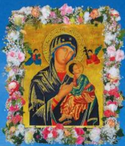
Mutter von der Immerwährenden Hilfe