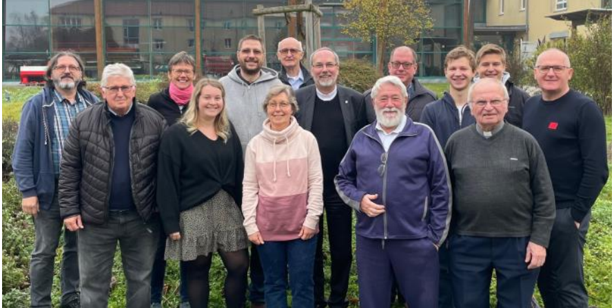
Teilnehmer an der Klausur des Pfarrgemeinderates