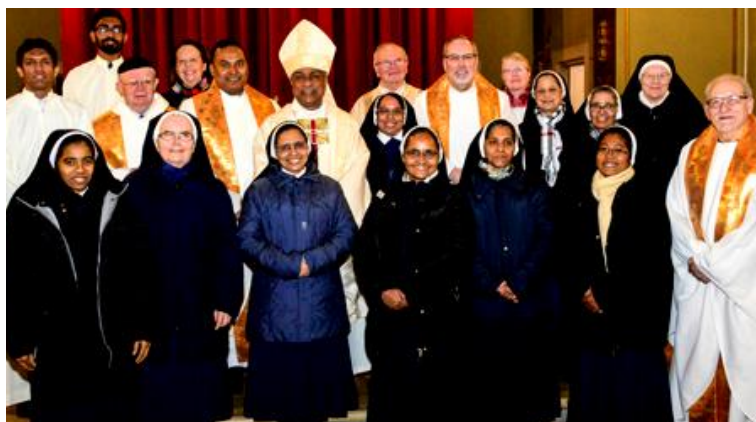
Gruppenbild nach dem Gottesdienst am 15. März