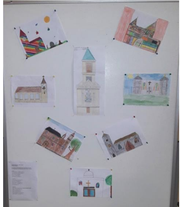
Bild: Die prämierten Zeichnungen aus den 2.,3. und 4. Volksschulklassen; vor allem aus der VS Wichtelgasse und VS Kindermanngasse