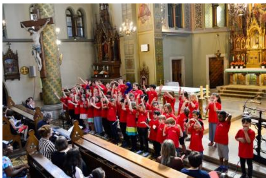
Der Schulchor beim Konzert