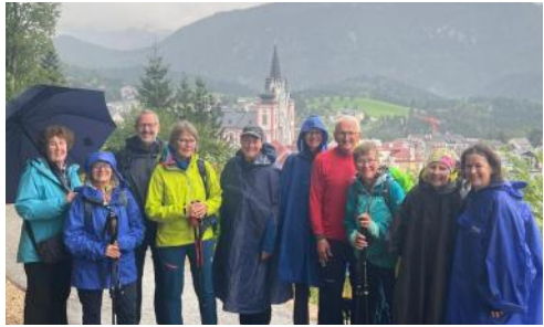
Foto: Gruppe vor Mariazell